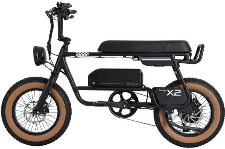
● Midnight Black