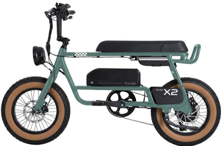
● Forest Green