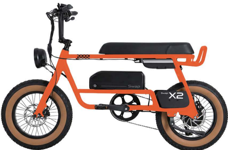
● Vivid Orange